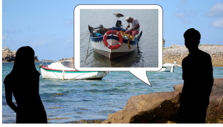
Phylactère vers Gwenn : image 4