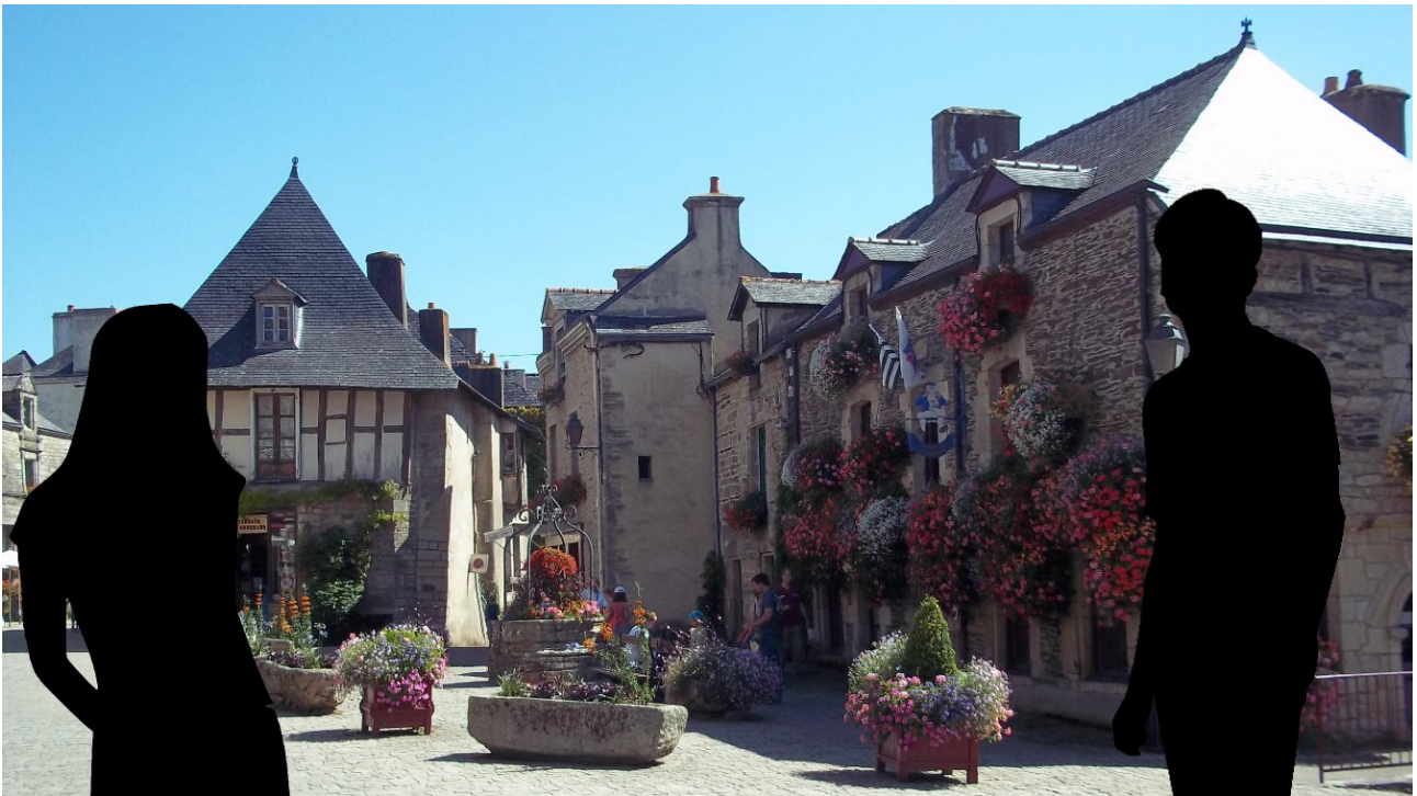
Fond de base